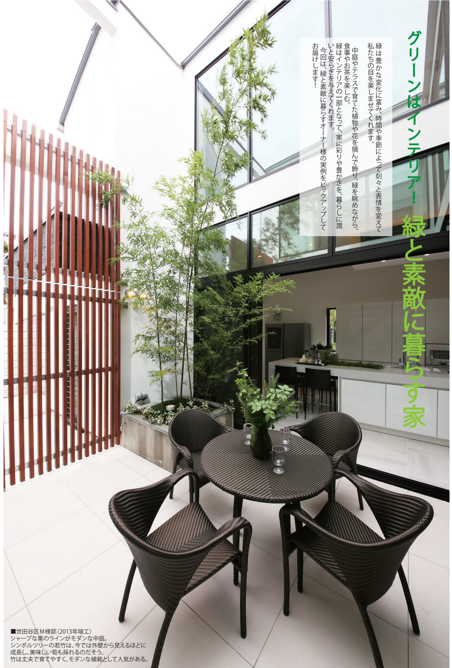
■世田谷区M様邸(2013年竣工) シャープな黒のラインがモダンな中庭。シンボルツリーの若竹は、今では外壁から見えるほどに成長し、美味しい筍も採れるのだそう。竹は丈夫で育てやすく、モダンな植栽として人気がある。

緑は豊かな変化に富み、時間や季節によって刻々と表情を変えて私たちの目を楽しませてくれます。 中庭やテラスで育てた植物や花を摘んで飾り、緑を眺めながら、食事やお茶を楽しむ。 緑はインテリアの一部となって、家に彩りや豊かさを、暮らしに潤いと安らぎを与えてくれます。 今回は、緑と素敵に暮らすオーナー様の実例をピックアップしてお届けします!